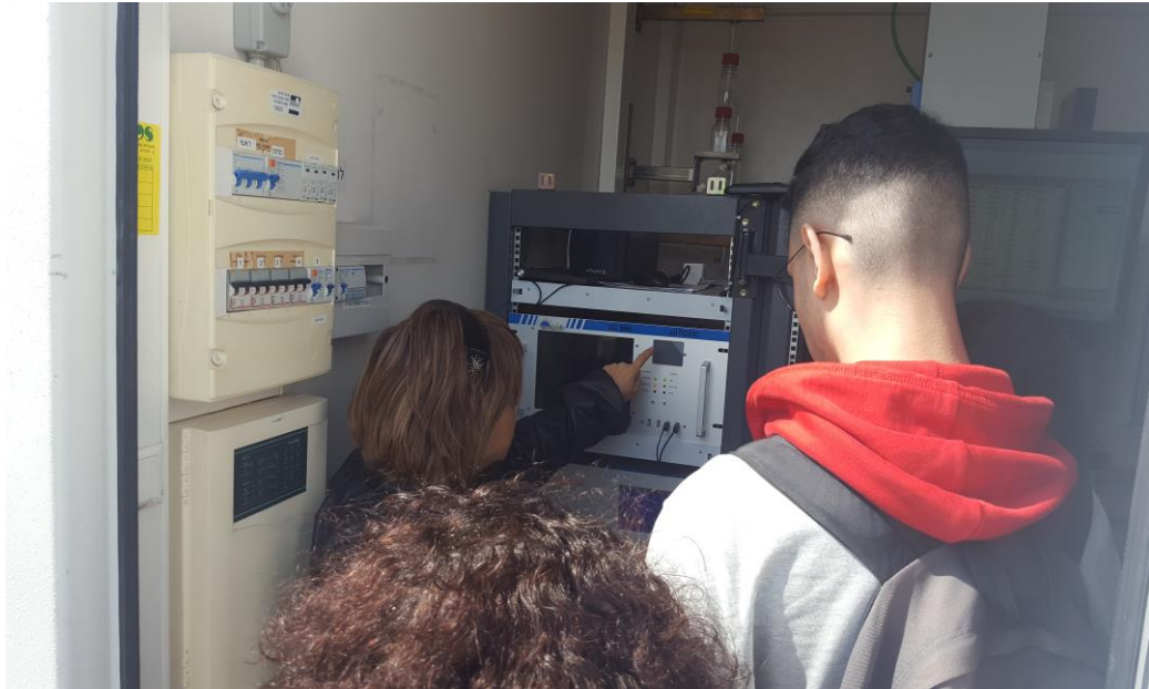
ביקור בתחנת ניטור איגוד ערים, ביי"ס אורט בנימינה (2.2019)