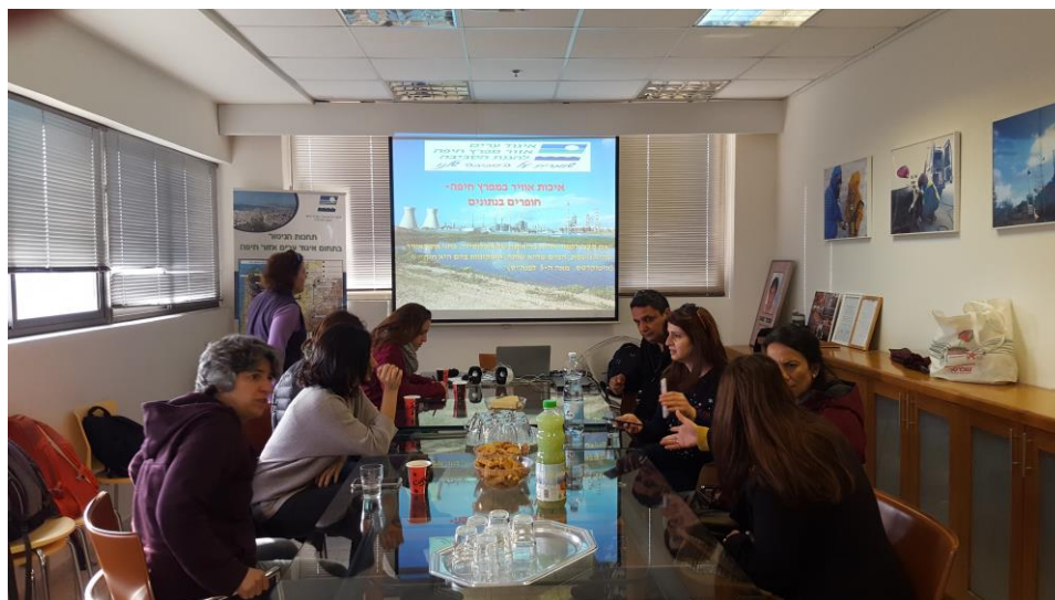
השתלמות מורים לגאוגרפיה (12.2018)