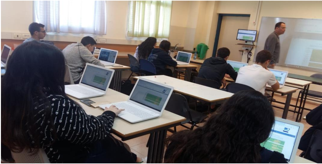
סדנת חקר נתוני זיהום אוויר חטי"ב כרמל זבולון (2.2019)