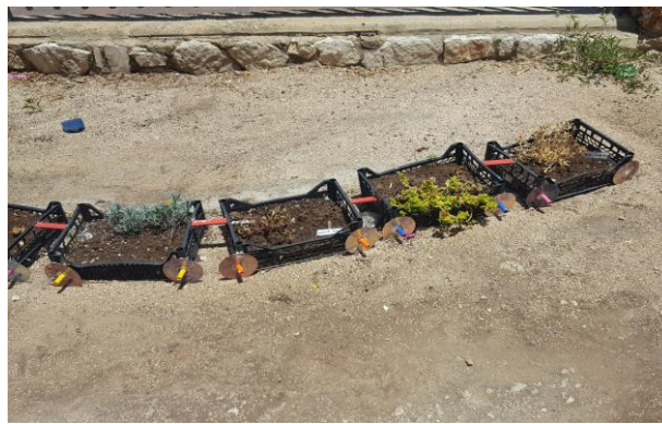
טיפוח מרחבים ירוקים בגני ילדים, רכסים