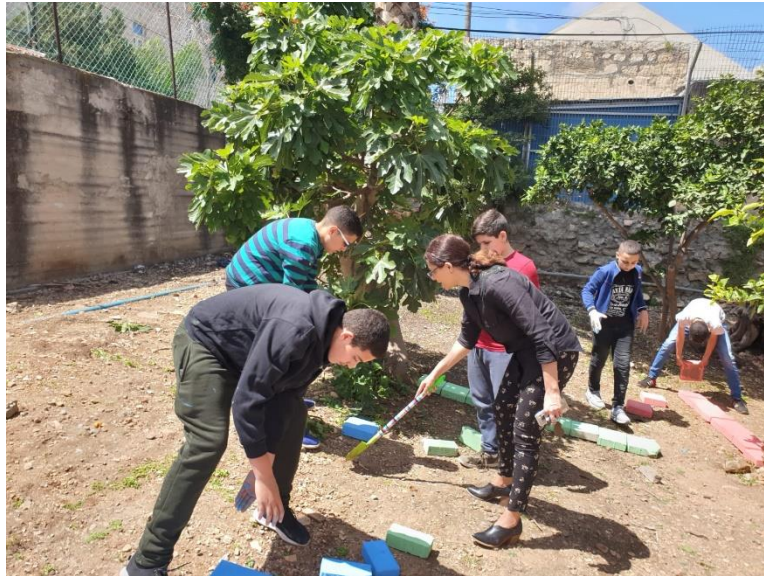
טיפוח שטח ציבורי (ואדי ניסנאנס), ביי"ס יוחנן הקדוש, חיפה