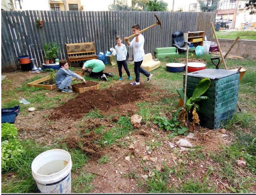
בניין ירוק , טירת הכרמל