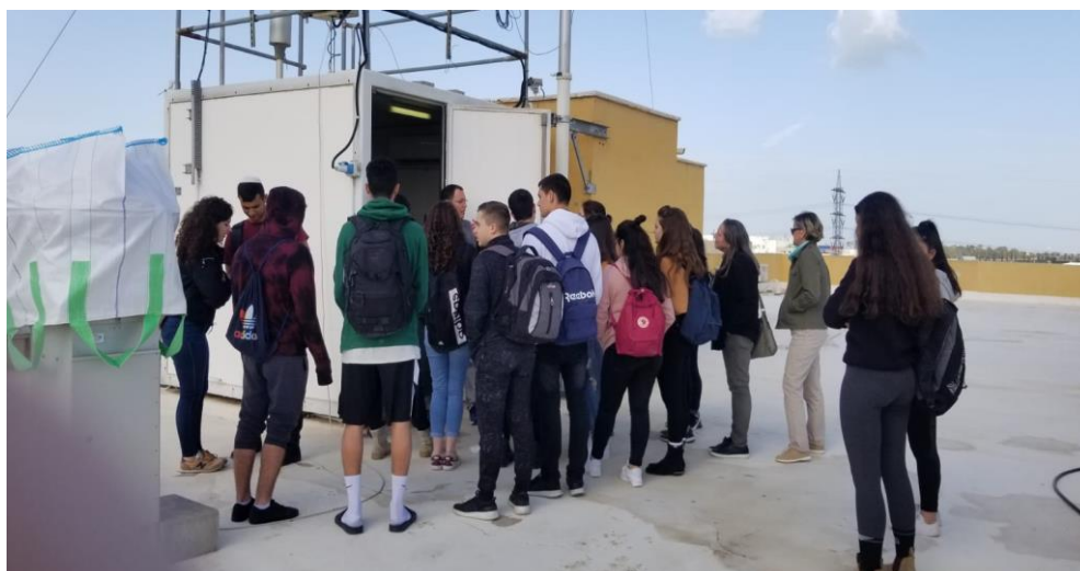
ביקור תלמידים תיכון חדרה ( 1.2019 )