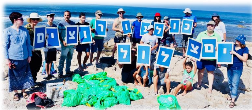
פעילות בחוף הים, נאות פרס, חיפה