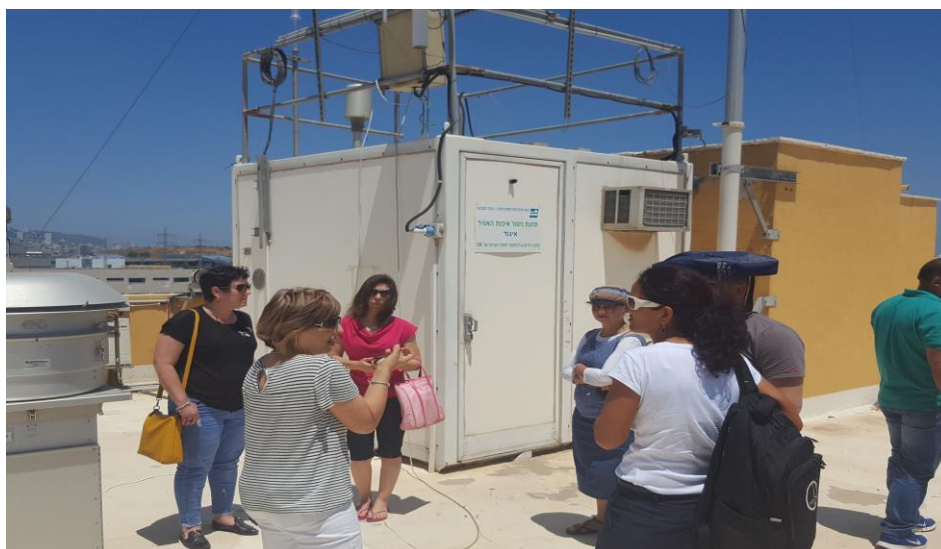
השתלמות מורים לכימיה (7.2019)