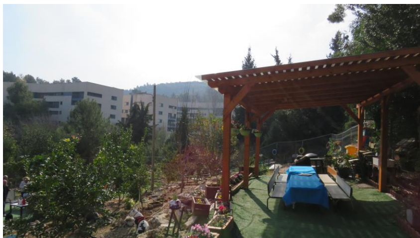
פיתוח מרחב ציבורי בגינה קהילתית – רמת אלון, חיפה