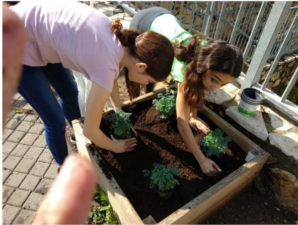
פיתוח מרחבים ירוקים בבי"ס גבעת רם, קריית אתא