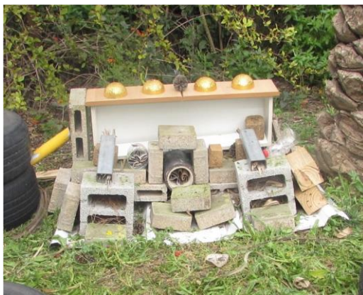
בית מלון לחרקים, בי"ס ירושלים, קריית אתא