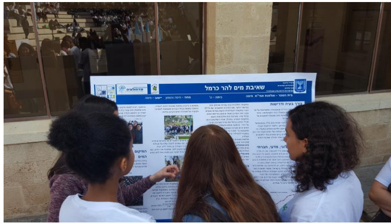
כנס מדוזולוגיה - הצגת עבודות חקר בתחום משאב המים העירוני, חיפה

יוזמות קהילתיות סביבתיות (קול קורא 2017 - פרק ג') במסגרת קול קורא 2017 התבצעו היוזמות הבאות: